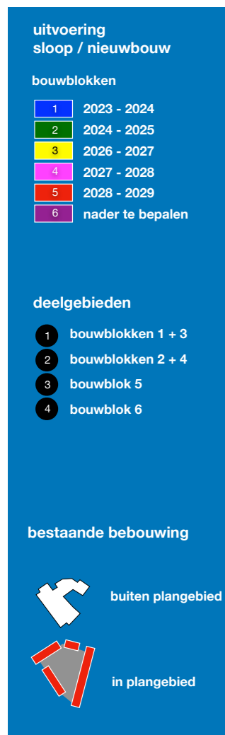
Plattegrond van de wijk Het Eiland, met de verschillende fases en deelgebieden voor sloop en nieuwbouw van Elkien.

We vinden het belangrijk dat we zoveel mogelijk materialen hergebruiken. Daarom gaat het bedrijf New Horizon voor Elkien de woningen van fase 1 slopen. Of zoals ze het zelf noemen: oude grondstoffen oogsten om opnieuw te gebruiken. Zo is er minder afval, besparen we grondstoffen en is de CO 2 -uitstoot lager.